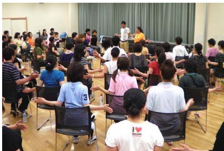
佐野先生指導による楽しい研修風景