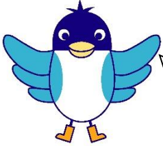
あんしんすこやかセンター イメージキャラクター あんすこくん