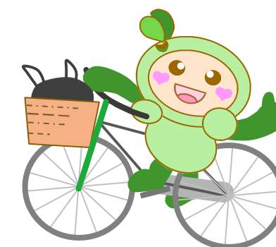
マスコットキャラクター シャジー