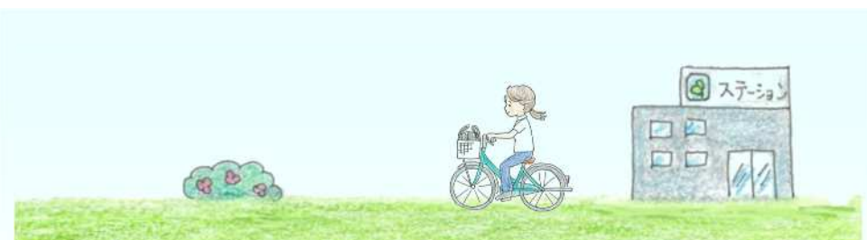
イラスト: 訪問看護ステーション三軒茶屋 看護師 河村祐子