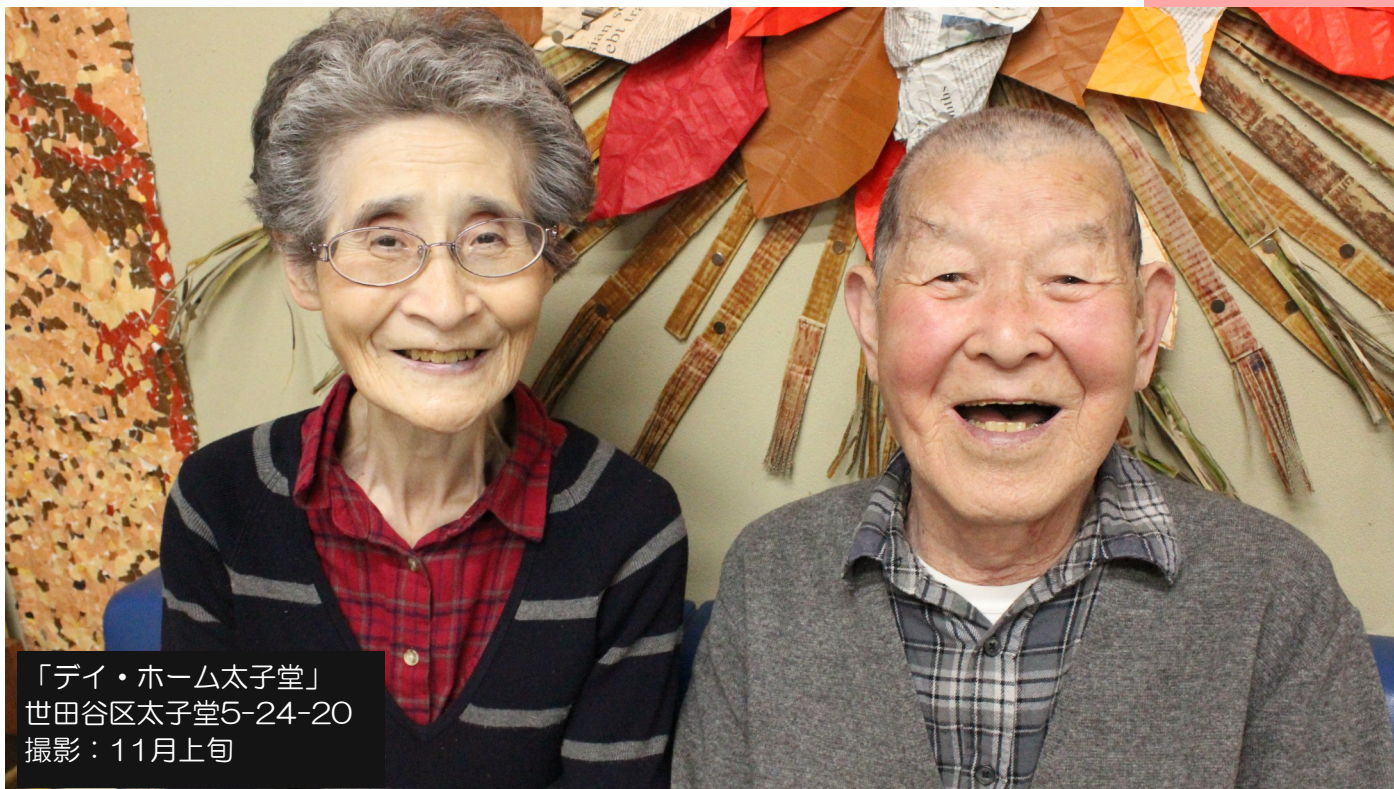
「デイ・ホーム太子堂」 世田谷区太子堂5-24-20 撮影：11月上旬