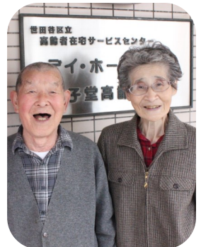
▲歩いて通所されます

長野県の高校から、東京学芸大学に入り卒業後、中学校の社会科専門の教員になりますが、「つまらない」を理由に小学校の教員になりました。教員時代に世田谷区が開催するテニス大会で優勝経験もあり、小学校ではテニス部の顧問をされ、定年まで教員として働かれました。「近いうちに小学校の同窓会に呼ばれているんだよ。行くのが楽しみでね。」と教えて頂きました。