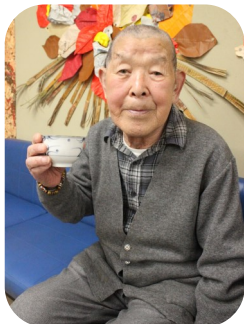
▲デイ・ホームに到着して一服

普段は奥様と三軒茶屋まで買い物に出かけて、コーヒーと一緒に飲むことが日課で楽しみにされています。食事の好き嫌いを伺うと、「好きな食べ物は、すき焼きとポテトサラダ。嫌いな食べ物は無いね。」と話され、「妻の作るポテトサラダは美味しいよ」と笑顔でお答えくださいました。